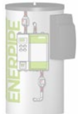
ÜPDL mit Frischwasserstation und Ultraschall-Wärmemengenzähler