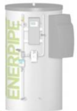
HPDL mit Frischwasserstation und Ultraschall-Wärmemengenzähler