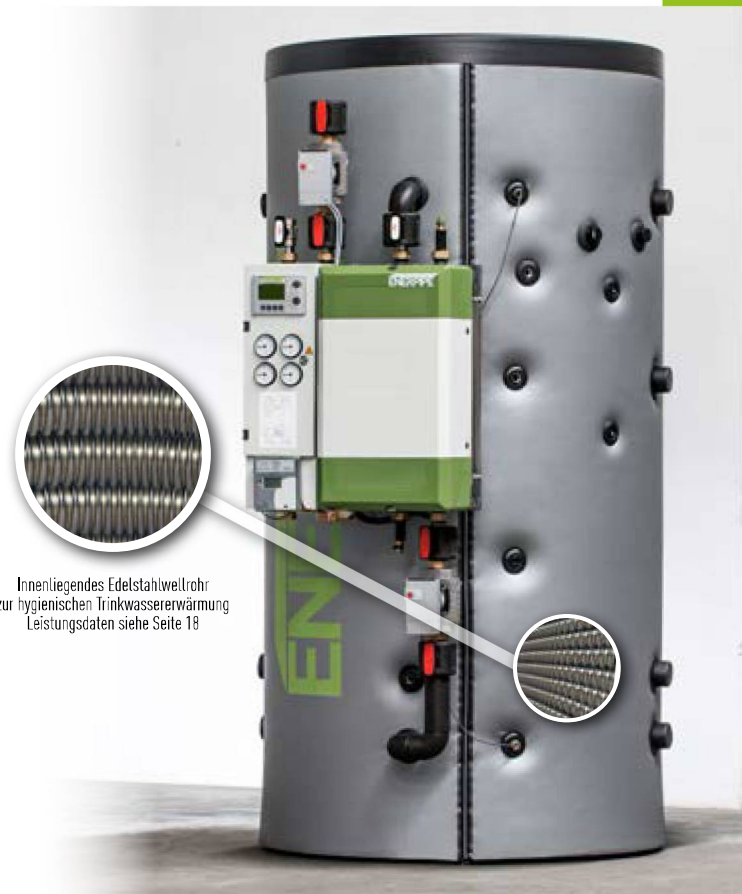
Innenliegendes Edelstahlwellrohr zur hygienischen Trinkwassererwärmung Leistungsdaten siehe Seite 18