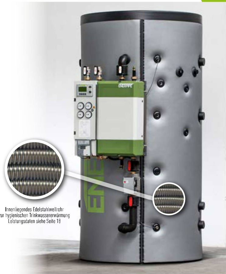
Innenliegendes Edelstahlwellrohr zur hygienischen Trinkwassererwärmung Leistungsdaten siehe Seite 18