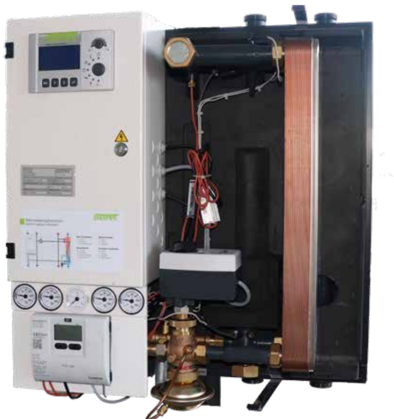
Übergabestation ohne Verkleidung